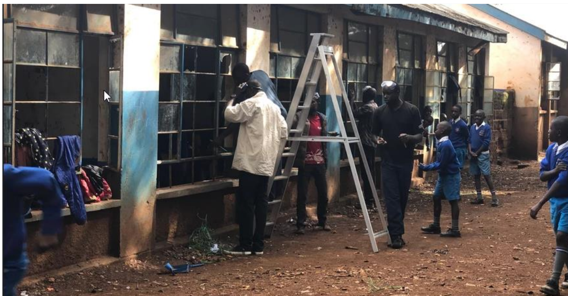
Werkzaamheden aan de ramen onder het toezien oog van de schoolkinderen

Samen met vrijwilligers en lokale bouwvakkers zijn in juni meer dan 1.100 nieuwe ramen geplaatst. Daarnaast is het lekkende dak van de kinderopvang gerepareerd en zijn een aantal lokalen geschilderd. Samen met de Galaxy Hardware Store in Eldoret hebben we hier direct impact kunnen maken voor de kinderen van de school en tegelijkertijd de lokale economie kunnen steunen.